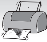
IMAGEN E IMPRESIÓN

Antes de imprimir tu diseño, asegúrate de que la imagen NO esté reflejada, sino al derecho, con la orientación normal.